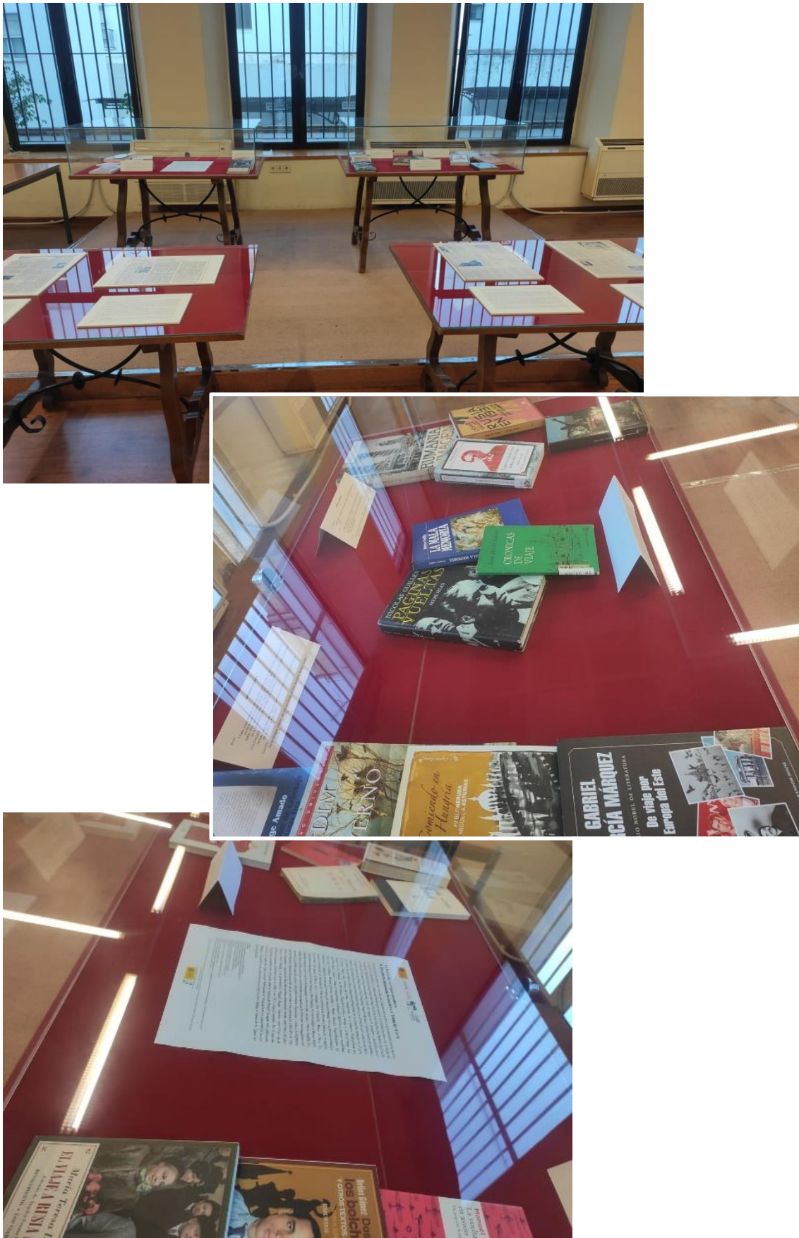
Fig. 3. Imágenes de la exposición En busca de la utopía socialista: la literatura latinoamericana tras el Telón de Acero