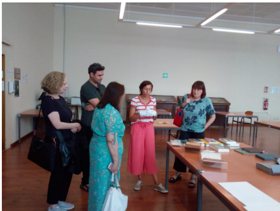
Fig. 2. Visita de las investigadoras participantes en la Red i Link 2022 «Arte, política y cultura». Mujeres y naciones, viajes y tránsitos. Contribuciones, avances y retrocesos, entre Europa y América (siglos XX-XXI) .

La otra colaboración de este tipo ha sido, dentro del programa de investigación “Escritores latinoamericanos en los países socialistas europeos durante la Guerra Fría” (PID2020-113994GB-I00), realizar una exposición bibliográfica titulada En busca de la utopía socialista: la literatura latinoamericana tras el Telón de Acero durante la Semana de la Ciencia del 7 al 20 de noviembre. En esta exposición se testimonia el impacto de la literatura latinoamericana en los países socialistas europeos, prestando especial atención a los casos yugoslavo y rumano a través de material bibliográfico y hemerográfico ( Vídeo promocional de la exposición ).