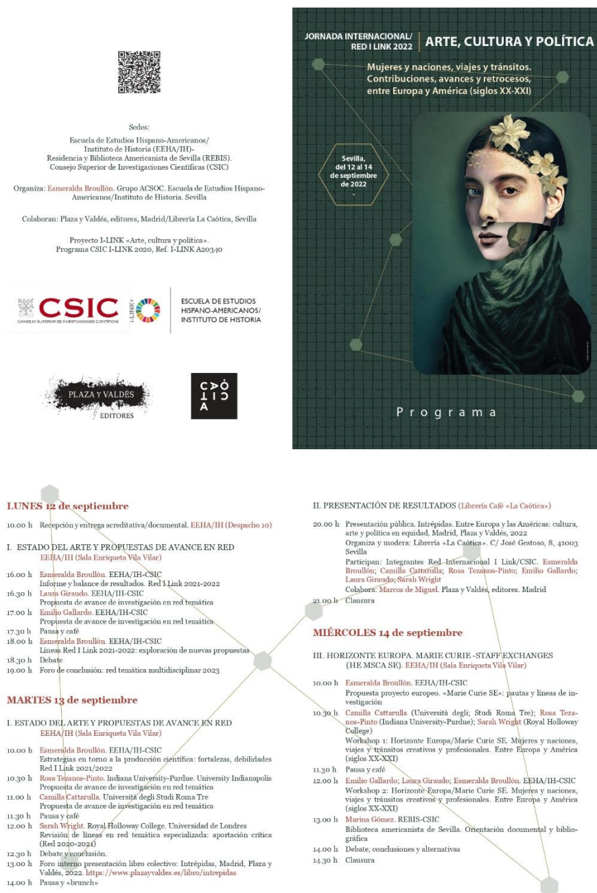
Fig. 4. Cartel y Programa de la Jornada de la Red i Link 2022 «Arte, política y cultura». Mujeres y naciones, viajes y tránsitos. Contribuciones, avances y retrocesos, entre Europa y América (siglos XX-XXI)

La sinergia y colaboración existe también en sentido inverso. Los responsables de la publicación de la EEHA-IH Anuario de Estudios Americanos solicitan dos ejemplares de los libros sobre los que publican reseñas, y uno de ellos es entregado como donación a la Biblioteca. Se trata de una vía más de entrada de libros, lo cual siempre es ventajoso y enriquecedor para los fondos bibliográficos y para la enorme variedad temática que existe dentro del americanismo. Y finalmente, no podemos olvidar la disposición que tienen siempre en colaborar con los eventos bibliotecarios en los que participamos, como fue en el año 2021 con REDIAL y este año 2022 en el Primer Encuentro de Bibliotecas Americanistas de Sevilla.