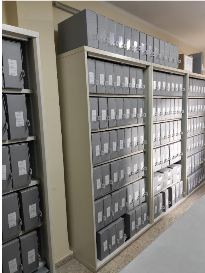
Fig. 2. Archivo después de unificarlo y en custodia en cajas de conservación

Otro punto que se ha abordado es la dispersión de los cuatro grupos documentales separados físicamente hasta que a principios de este año 2022 se han unificado en una sola estancia del edificio. Así mismo y aprovechado dicha unificación, desde 2021 se han adquirido cajas de conservación para todo el material, procurando así su correcta custodia y conservación.