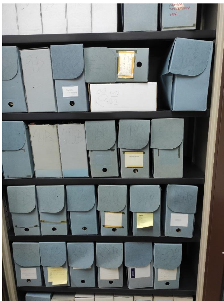
Fig. 1. Archivo antes de su unificación y custodia en cajas de conservación.

La independencia de estos cuatro grupos documentales la da su propio contenido temático, pero de la misma manera, este contenido muestra la sinergia entre ellos, por ejemplo, en la relación administrativa que conlleva la compra de libros y revistas a través de las distintas partidas presupuestarias y subvenciones concedidas a la Escuela o Biblioteca, lo que pone de manifiesto la relación entre el archivo histórico de la EEHA y el de la biblioteca. Esta sinergia se ve también en la difusa frontera que existe entre la documentación personal e institucional en el caso de investigadores con cargos en la EEHA, como es el caso del que fue vicedirector de la EEHA, Francisco Morales Padrón.