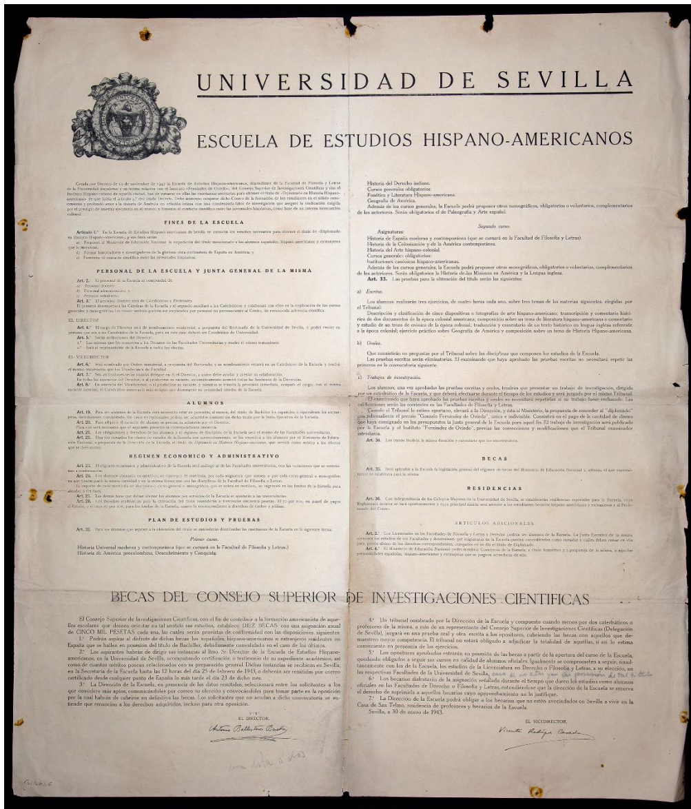
Fig. 3. Documento de la fundación de la Escuela de Estudios Hispanoamericanos (1943)

Este archivo histórico está formado por documentación desde 1943 a 1992. Ambos años son significativos para el centro, el primero por ser la fecha de la fundación del instituto y el segundo por ser el de la Exposición Universal del 92 y fecha emblemática para el mundo americanista en Sevilla, fijándose por ello como año final del archivo histórico de la EEHA.