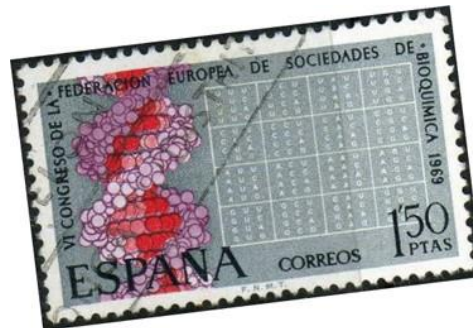
Ilustración 2. Sello de correos emitido por la FNMT.

Otros datos que otorgan al congreso un gran valor: el cartel fue diseñado por Salvador Dalí especialmente para la ocasión y la Fábrica Nacional de Moneda y Timbre emitió un sello de correos con la figura del DNA y la tabla del código genético.