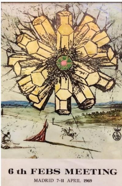
Ilustración 3. Cartel diseñado por Salvador Dalí.

El marco social e histórico en el que se encuadra el Congreso también es apasionante ya que 1969 es un año cuajado de hechos memorables: el hombre llega a la luna y se realiza el primer vuelo del Concorde. A nivel nacional España se encuentra en estado de excepción debido a las revueltas universitarias, lo cual hizo temer por la celebración del evento. Por fortuna días antes del inicio del Congreso se levantó el estado de excepción y pudo desarrollarse con normalidad.