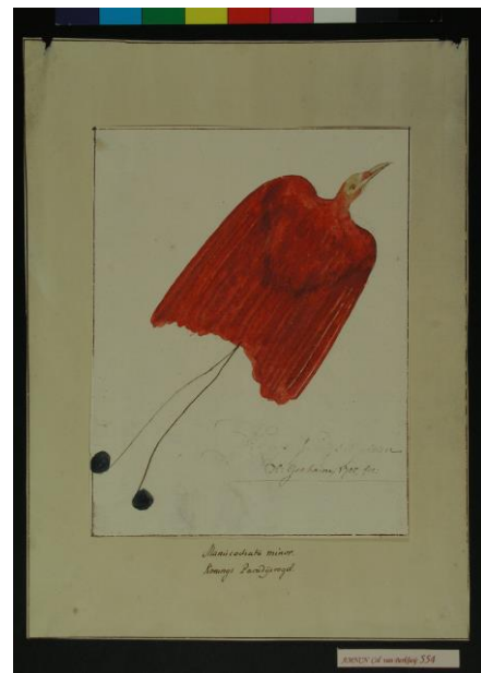
Ave del paraíso real - Cicinnurus regius -

Otro de los autores con más obra después de van Berkhey dentro de la colección es Jacob L'Admiraal (1700-1770). Perteneciente a una familia de artistas y grabadores, fue junto con su hermano Jan discípulo de Le Blon, el inventor de la tricromía y la tetracromía. Estas técnicas eran más adecuadas que las existentes en aquel momento para la representación de la amplia gama de colores que se dan en la naturaleza. Jacob fue famoso en su época por sus representaciones de metamorfosis de mariposas como la de la esfinge del aligustre ( Sphinx ligustri ) presente en la exposición. Al igual que el resto de sus obras de la colección, esta se encuentra inacabada y en ella aparecen un imago y orugas en diferentes estadios alrededor de una rama.