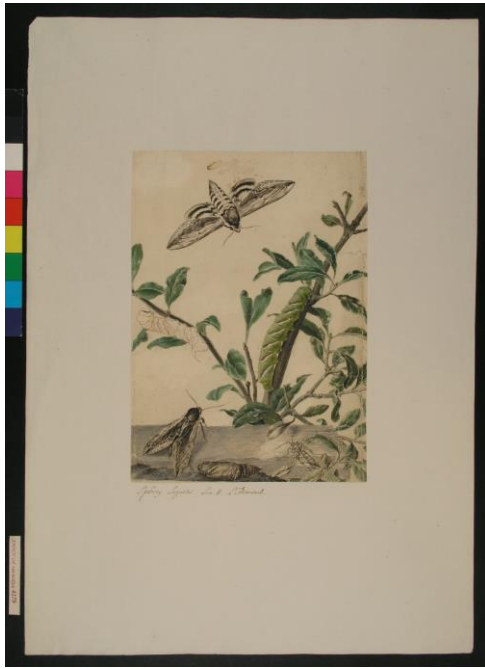
Esfinge del aligustre -Sphinx ligustri-