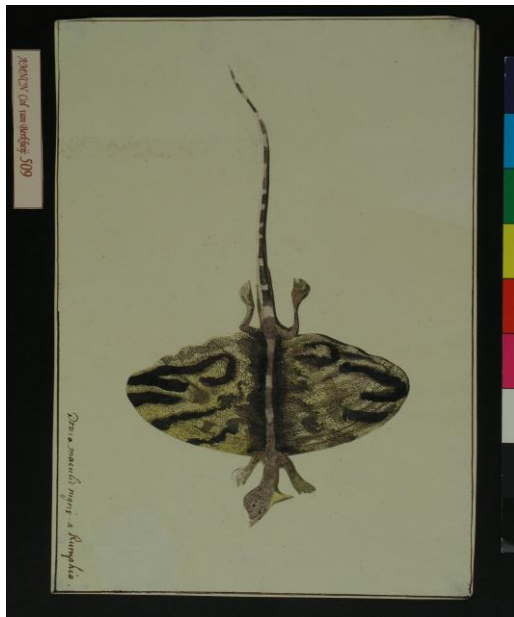
Dragón volador manchado - Draco maculatus -