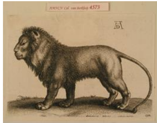
León -Panthera leo-