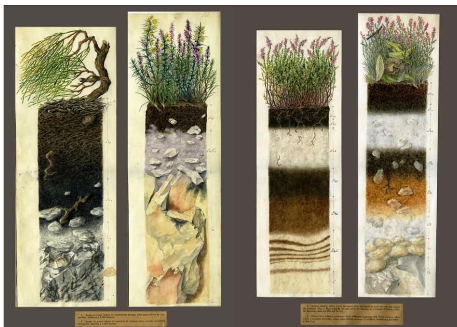
Colección de láminas delgadas de suelos

Nos han llegado una inmensidad de diapositivas y negativos, muchos de estos documentos, aún por ver y clasificar.