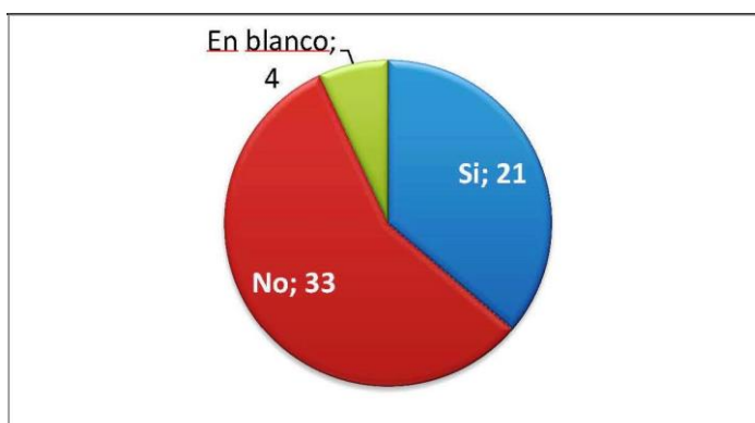
¿Desea participar en su elaboración?