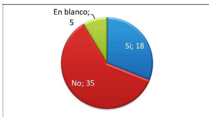
¿Desea escribir algún artículo en los próximos meses?

Son de gran interés los comentarios recibidos en los campos de texto libre donde cada persona, bibliotecarios o archiveros de la Red, ha manifestado su opinión de forma abierta. No han sido muchas las respuestas, pero las sugerencias son positivas. Para una mayoría Enredadera cumple la función de boletín de comunicación de la Red gracias al cual nos conocemos y mantenemos una relación estrecha que nos cohesiona y nos permite trabajar con parámetros comunes. Hay varias voces que invitan a actualizar el formato, a adaptarlo a las nuevas tecnologías pero quizás solo como “un lavado de cara” ya que la mayoría se siente identificado con el contenido. Varias sugerencias invitan a que haya más bibliotecas que participen y que con ello podamos tener un contenido más