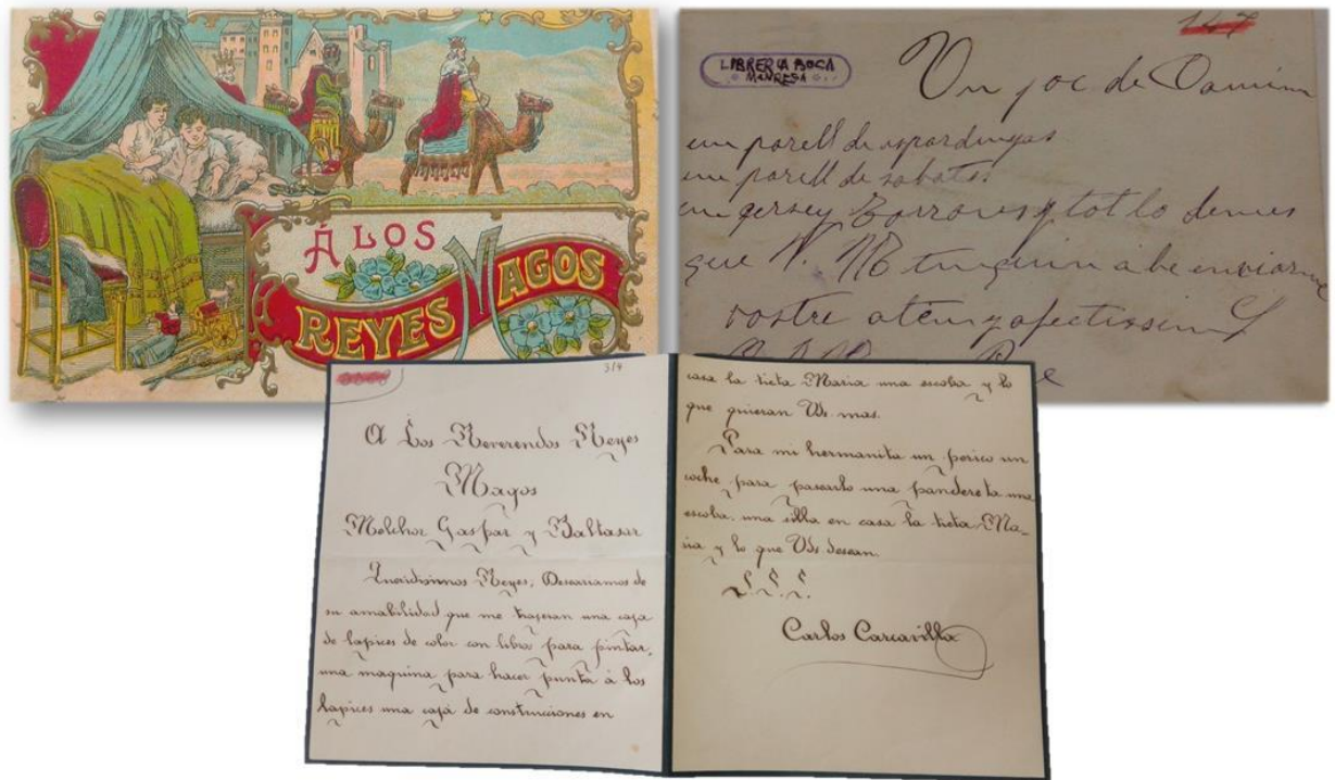
Foto 3. Ejemplos de cartas a Reyes Magos

Por otro lado, el Archivo de Psicología también comprende unas 250 carpetas temáticas con documentos fechados entre finales del siglo XIX y la primera mitad del siglo XX. Todos los elementos que forman parte de ellas han sido descritos individualmente para poder recuperar su información con facilidad. Asimismo, también se conservan unos 1.200 recortes de prensa de las principales publicaciones catalanas y madrileñas de la primera mitad del siglo XX, no sistematizados con anterioridad. En este caso, se ha optado por llevar a cabo una ordenación temporal según la temática y el año de impresión de la publicación de manera análoga al criterio anteriormente aplicado.