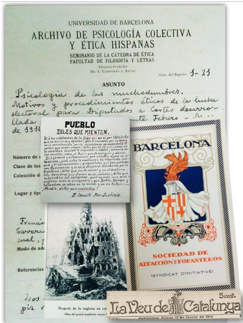
Foto 2. Carpeta del Archivo de Psicología y Ética Hispánicas junto a varios ejemplos de documentos de diversa temática

En un primer momento la ordenación de los trabajos de observación directa y de recolección de “documentos vivos” siguió un orden de entrada inventariado. Con posterioridad, se diseñó una clasificación lógica en departamentos temáticos relacionados con los temas tratados por la Cátedra de Ética. Entre estas materias se encontraban diversos aspectos referentes a la “psicología de la muchedumbre”, tales como el cooperativismo y solidaridad obrera, literatura sindicalista y de boicot, sicalipsis, flamenquismo, mendicidad, supersticiones fatalistas y adivinatorias, responsabilidad moral del comprador, etc. Tras la incorporación de Tomás Carreras al CSIC, en los primeros años de la década de 1940, realizó una reorganización parcial, numerando cada documento y utilizando nuevas carpetillas donde eran sistematizados distintos datos relevantes sobre la documentación recogida en ellas. Este trabajo quedó inconcluso, algo que ha condicionado su tratamiento archivístico.