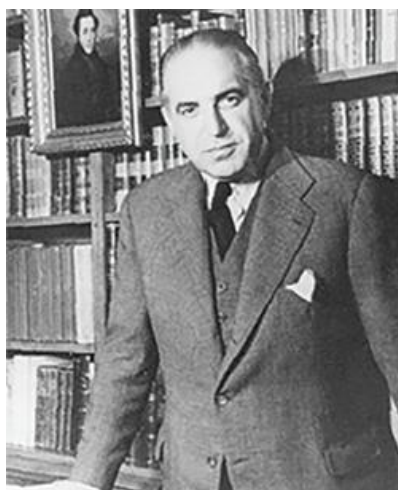
Ilustración 1. Marañón en su biblioteca

Son infinitas las descripciones sobre su obra y su labor. Elegimos esta porque evidencia su capacidad como escritor transmitiendo sus conocimientos e ideas: " Marañón, " escribe el historiador Juan Pablo Fusi, " fue un acontecimiento, algo que le sucedió a la sociedad española del siglo XX, ... ' una clave española ' necesaria para comprender nuestro sino histórico cultural y científico. Su obra, intimidante por su volumen y calidad, comprende 125 libros, 1800 artículos y 250 prólogos" (4).