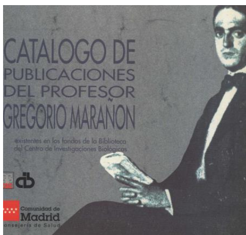
Ilustración 3. “Catálogo de Publicaciones del Profesor Gregorio Marañón”.

firme de la Dirección del CIB, y el soporte técnico de la Unidad de Coordinación de Bibliotecas del CSIC. Después de muchas vicisitudes, la Consejería de Salud de la Comunidad de Madrid financió la edición del “Catálogo de Publicaciones del Profesor Gregorio Marañón”. Se trata de una relación bibliográfica de 623 documentos extraídos de la colección encuadernada, y seleccionados por criterios que se describen en su introducción. El libro fue presentado en la Residencia de Estudiantes en octubre de 1994 y durante años fue distribuido entre muchas instituciones nacionales y extranjeras. El Catálogo digitalizado puede verse en Digital.CSIC, así como una relación detallada de todo el proceso, un resumen del acto de presentación y una reseña del libro. (9) (foto 3).