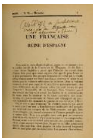
Ilustración 2. Galeradas del texto inédito “ Une française reine d’Espagne . Anotación autógrafa: “ No llegó a publicarse, creo que, por la llegada de los alemanes a París ”

Es oportuno comentar, aunque sea someramente, la relación del CIB con la Fundación Gregorio Marañón. Iniciada con entusiasmo a finales de los 80, finalmente no fue muy fructífera. Sirvió al menos para que los investigadores que allí acudían fuesen remitidos a nuestra biblioteca. Es el caso de su actual Director, el historiador Antonio López Vega, que consultó nuestro fondo para su tesis doctoral y que posteriormente publicó su “ biobibliografía ” completa (7). Años después, ese conocimiento llevó a seleccionar documentos significativos para diversas exposiciones sobre Marañón (Cincuentenario de su muerte, V Centenario de El Greco). Destacamos entre ellos la galerada de un artículo inédito: “ Une française reine d’Espagne ”, que contiene una nota autógrafa: “ No llegó a publicarse, creo que, por la llegada de los alemanes a París ” (8).