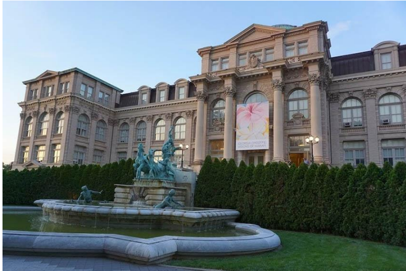
Mertz Library. NYBG. Sede del 2018 Annual Meeting.