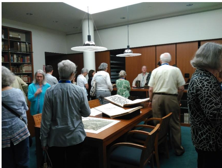
Visita guiada a las colecciones especiales de la Mertz Library NYBG