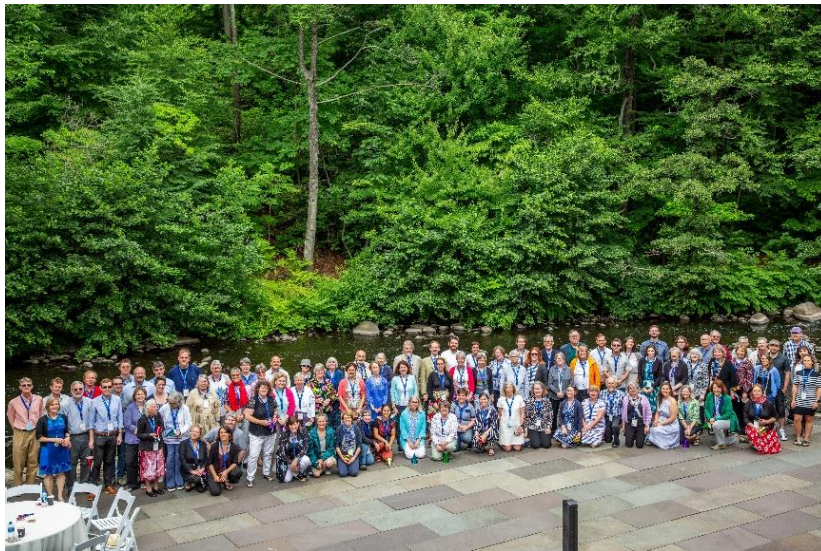
Asistentes al Encuentro EBHL/CBHL/Linnaeus Link