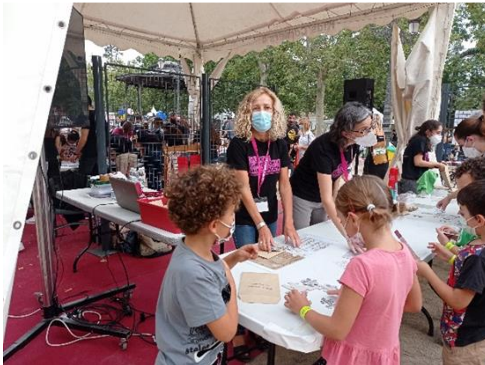
Figura 4. Desarrollo del Taller de manuscritos pieza a pieza.