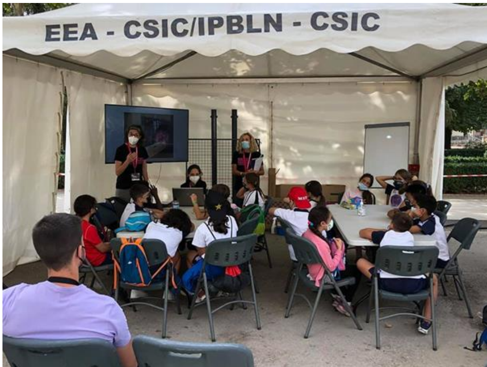
Figura 2. Desarrollo del Taller de copistas.