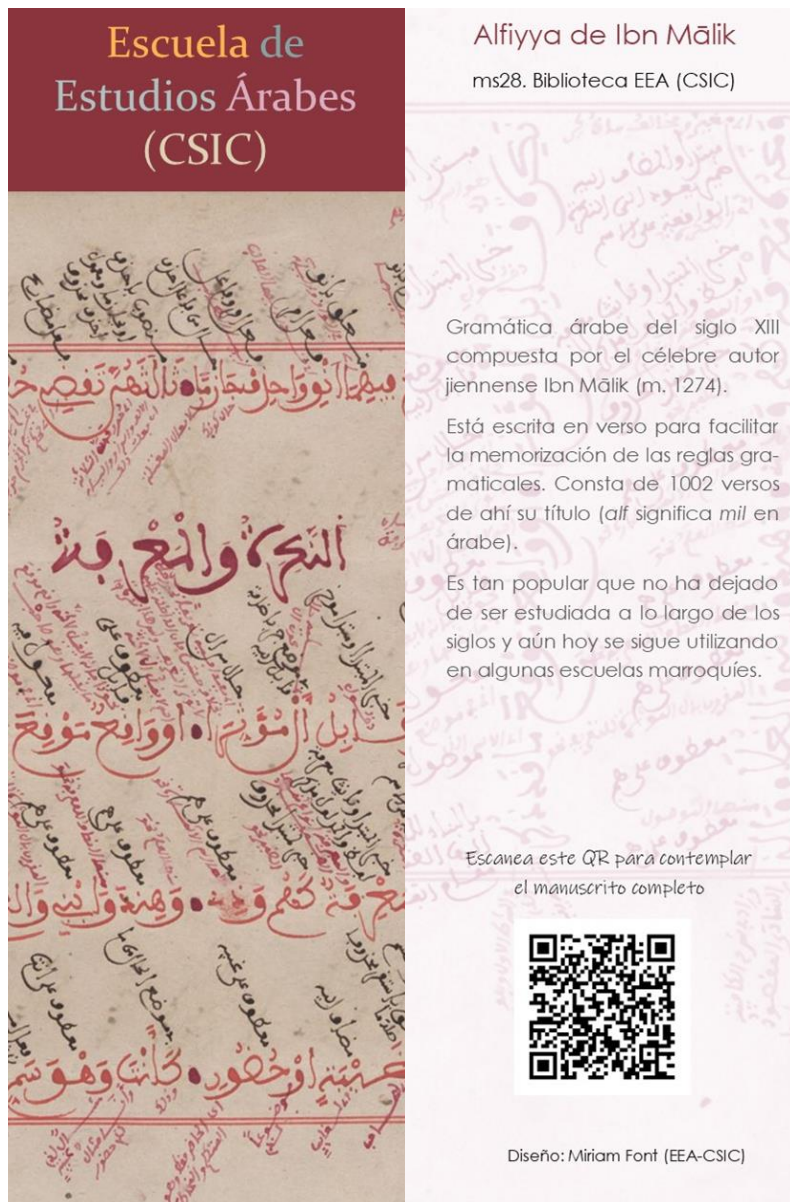
Figura 6. Marcapáginas de la Alfiyya.