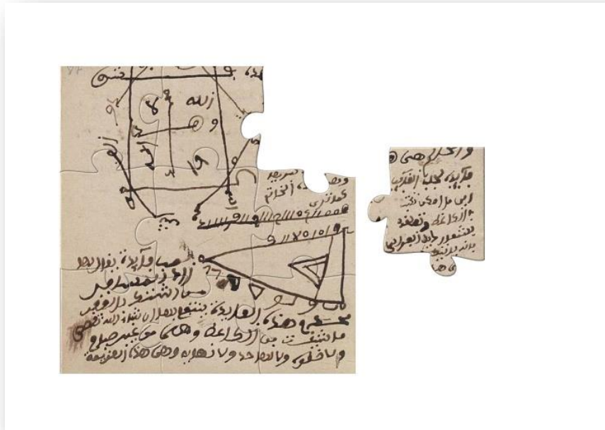
Figura 3. Manuscritos para puzzles.

Dirigido a un público de todas las edades al que se ofrecen puzzles con diferentes niveles de dificultad que reproducen la imagen de varios manuscritos seleccionados en función de su relevancia caligráfica y temática (figs. 3 y 4).