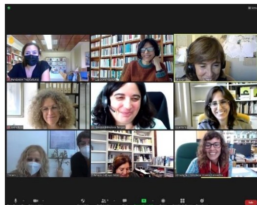
Figura 7. Pantallazo de la reunión

Por segundo año consecutivo participamos en la reunión Bibliotecas especializadas en mundo árabe e islam post pandemia: actividades y recursos en 2021 , convocada por la Biblioteca Félix Ma a Pareja (AECID), que, como en la edición anterior, tuvo que celebrarse de forma virtual debido a las restricciones impuestas por la pandemia). Otra interesante vía de colaboración para estrechar vínculos con instituciones afines, compartir experiencias y difundir nuestra labor (fig. 7).