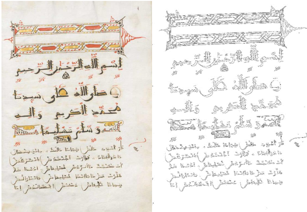
Figura 1. Tafçira del Mancebo de Arévalo y plantilla para su ejecución.