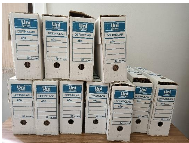
Figura 1. Recepción de las cajas archivadoras del fondo del Instituto Español de Musicología

Los fondos y archivos institucionales y personales constituyen una fuente primaria valiosa para la investigación, que en ocasiones puede resultar de difícil localización, recuperación y uso, por lo que la fase descriptiva dentro del tratamiento archivístico es primordial. En ella se elaboran los instrumentos de descripción que hacen posible el acceso a la información a partir de una representación exacta de las agrupaciones documentales que constituyen los fondos, y que van a posibilitar el control físico e intelectual de los documentos al ofrecer una información precisa de su contenido y facilitar el conocimiento, la consulta y la difusión de los fondos documentales custodiados en los archivos.