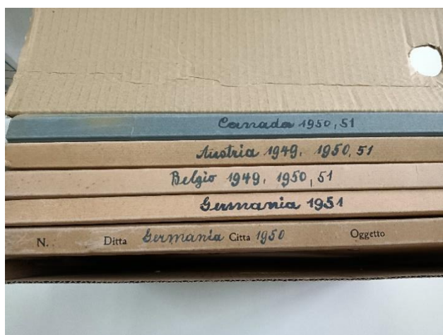
Figura 2. Carpetas originales con las notaciones manuscritas de Higinio Anglés

archivos que van a ser digitalizados deben inventariarse para conocer con exactitud los caracteres internos y externos de los documentos que los componen.