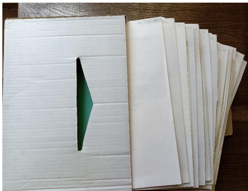
Figura 4. Instalación de las cartas en carpetillas de papel neutro

Lo que se conserva en las instalaciones de la Institución Milá y Fontanals es, básicamente, la correspondencia de entrada y salida de la dirección y la secretaría, los documentos de la gestión económica y personal –por ejemplo, las dietas y gastos de viajes –, así como la documentación generada por los propios investigadores en su trabajo científico individual, donde cabe destacar las cartas internacionales y las conferencias. También, se localiza lo que fue la propia documentación de la biblioteca, en especial lo relativo a la adquisición de nuevos fondos e intercambios internacionales, y el servicio de publicaciones que se encargaba de la edición de las revistas y otras monografías científicas.