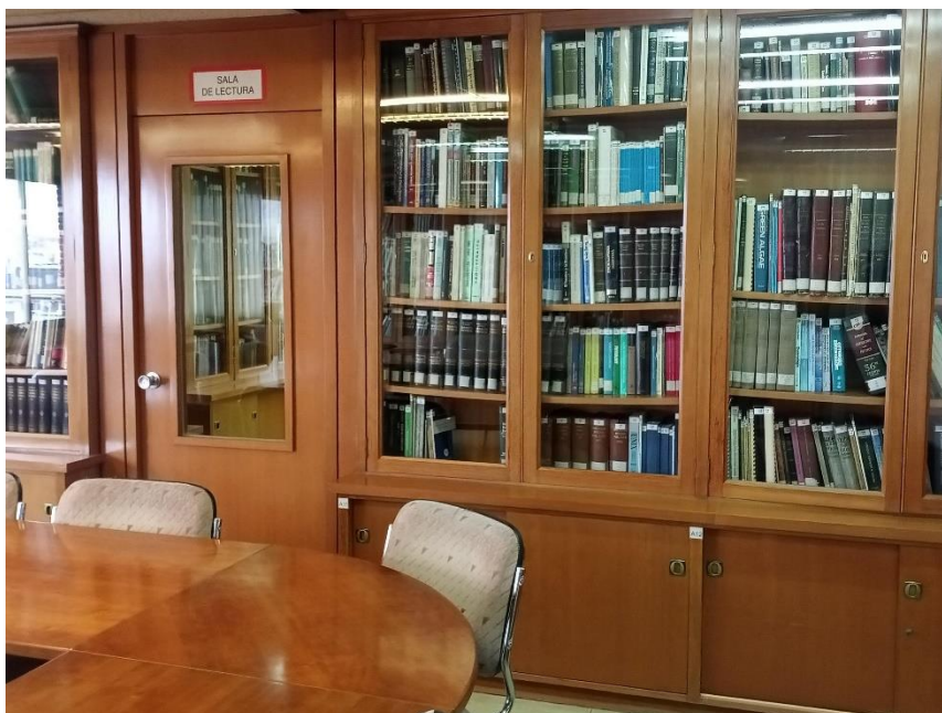
Figura 2. Biblioteca del IEO

Los servicios bibliotecarios básicos que se ofrecen son: