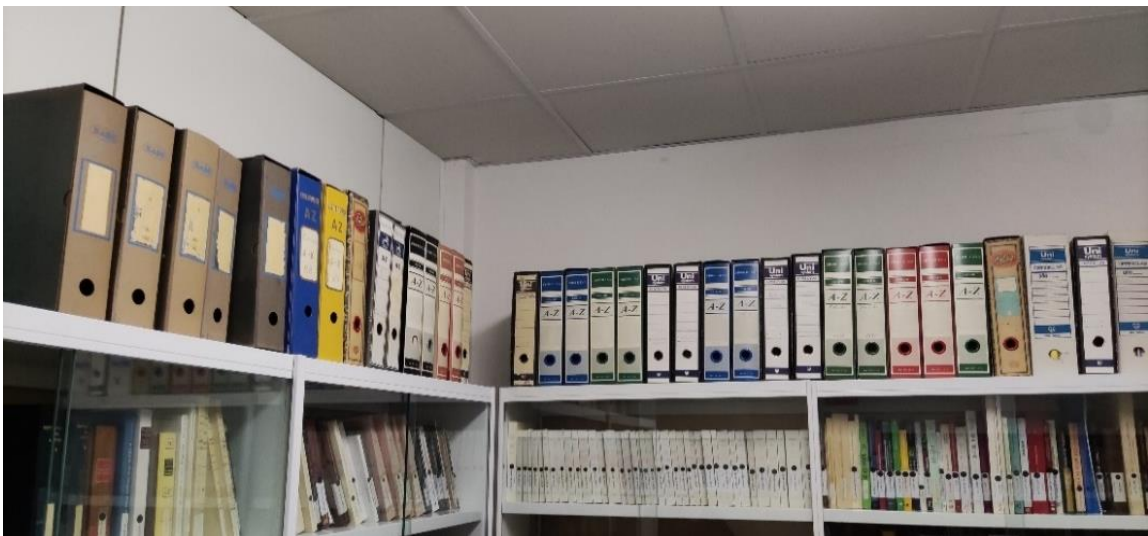
Ilustraciones 1 y 2: Fondo Luis García Ballester en su instalación original (arriba) y detalle de la organización de una carpeta (derecha).

El fondo documental tratado ha permanecido depositado y custodiado en las dependencias del grupo de Historia de la Ciencia hasta el año 2023, cuando Jon Arrizabalaga lo transfirió al Archivo de la IMF con el objetivo de que el legado de Luis García Ballester se conservara y preservara en condiciones adecuadas, y quedara a disposición de futuros investigadores interesados en la historia de la ciencia y medicina.