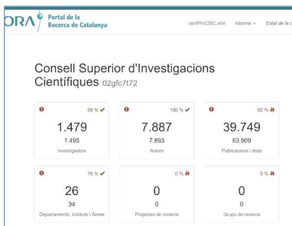
Il·lustració 1. Pantalla del resultat final de una validació de dades

Se recopilan y exportan los datos desde GesBIB, se realiza una validación en la herramienta correspondiente del PRC y, finalmente, se integra en el Portal. Es decir, da la sensación de que con solo pulsar una tecla todo está hecho. Y, aunque, en parte es así, no se suele ser consciente de que para llegar a este punto se ha pasado previamente por todo un proceso difícil y largo, en el que todos los actores implicados han puesto mucho de su parte para que finalmente se pudiera conseguir y, en el que, en ocasiones, se ha tenido que lidiar con obstáculos que parecían insalvables y hacían peligrar el proyecto.