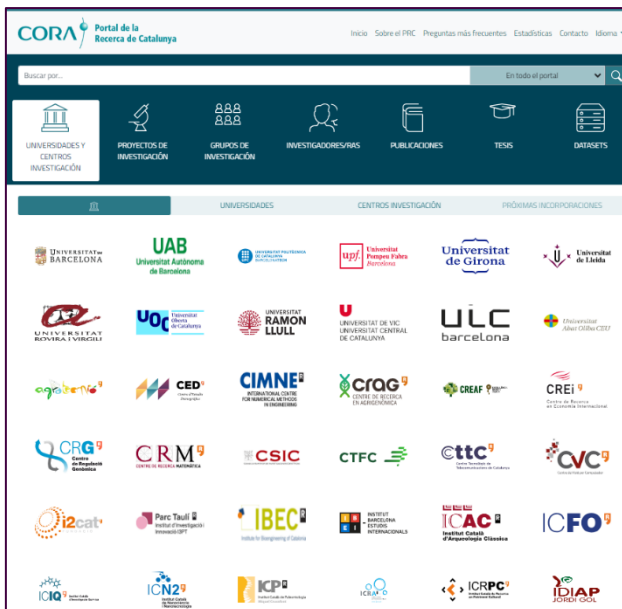
Ilustración 2. El logo del CSIC figura en el PRC junto a las demás instituciones y centros de investigación en Cataluña.

y en el anexo técnico. Una vez recibida, el CSIC daría respuesta aceptando la invitación. El coordinador informa a la dirección de la URICI y al responsable del PRC tanto de la dificultad con la que ahora se había topado como de la solución posible a la misma. El responsable del PRC lo ve bien y eleva su consulta a las autoridades del CSUC quienes, finalmente, también lo ven bien. A finales de abril e inicios de mayo de 2023 se revisan los flecos de esa carta de invitación y, a mediados de mayo se envía para su firma, cosa que sucede a finales del mes de mayo de 2023.